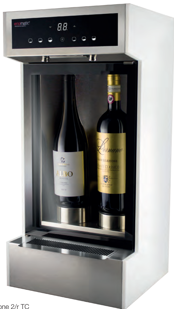
eno one 2/r TC Seitenblende weiß

NEUES UND INNOVATIVES WEINAUSSCHANKSYSTEM FÜR ZWEI FLASCHEN MIT VIELFÄLTIGEN FUNKTIONEN UND DER BEWÄHRTEN ENOMATIC® TECHNOLOGIE. NEBEN DEM MODERNEN UND ELEGANTEN DESIGN ZEICHNEN DIE EINFACHE PLUG & PLAY-INSTALLATION UND DER MODULARE AUFBAU DEN NEUEN ENO ONE AUS. MIT DEM ENO ONE MACHEN SIE WEIN ZUM ERLEBNIS. AUCH FÜR DEN GEBRAUCH ZU HAUSE GEEIGNET.